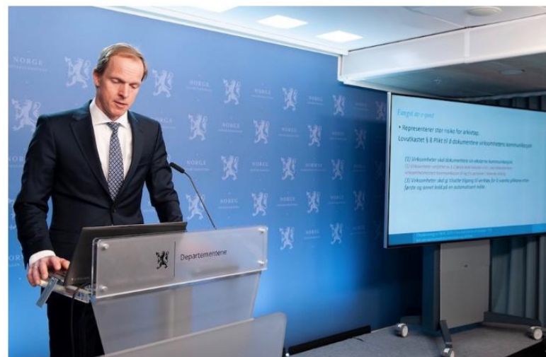
Kommunal Rapport støtter forslaget fra arkivlovutvalget, som var ledet av Christian Reusch, om at samme lovregler skal gjelde for alle kommunale selskaper.