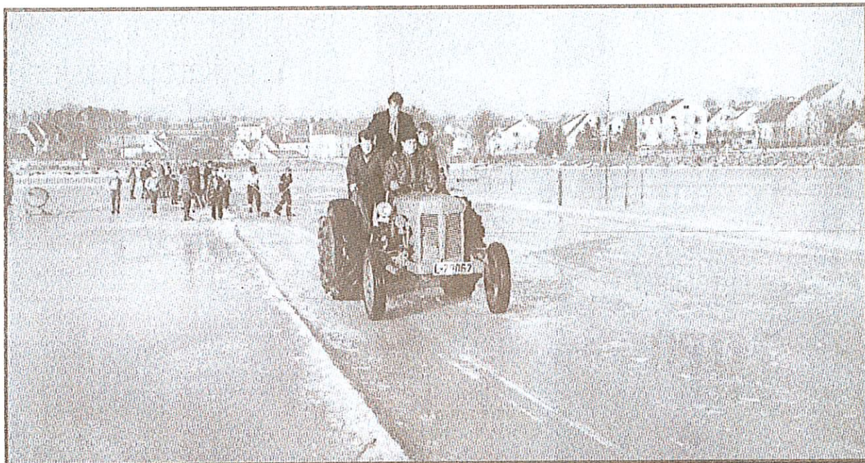
PREPARERING: I 1959 var isen god og Stokkalandsvatnet samlet ofte store skarer med skøytebarn, unge og voksne. En gråtass ble brukt på isen.