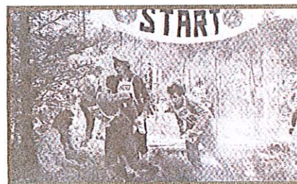
TERRENGLØP: Løpere fra Rogaland og andre deler av Vestlandet er rikelig representert i arkivet til Herredsvela. Vet noen hvem disse personene er, og hvor er bildet er tatt?